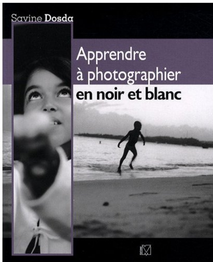
Apprendre À photographier en noir et blanc de Dosda Savine