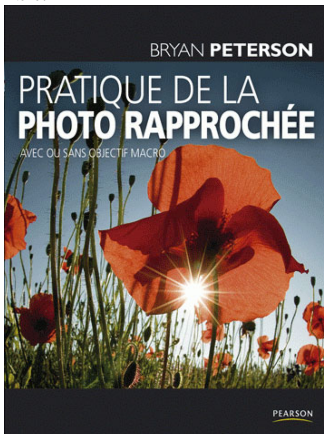
Pratique de la photo rapprochée : avec ou sans objectif macro de Bryan Peterson