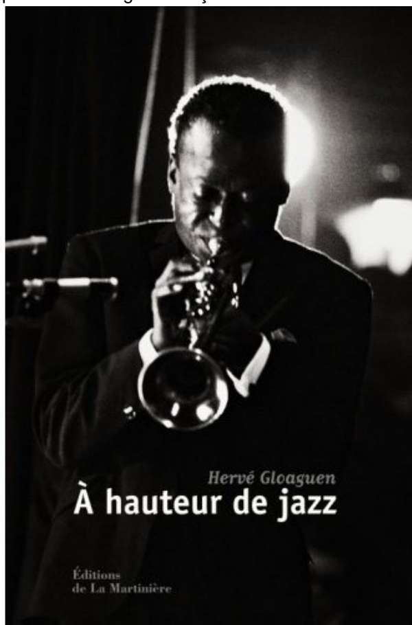
A hauteur de Jazz de Hervé Gloaguen

Les textes d'écrivains et les témoignages qui accompagnent ces soixante portraits révèlent combien le jazz est pour tous une incessante source d'inspiration et une grande leçon de vie.