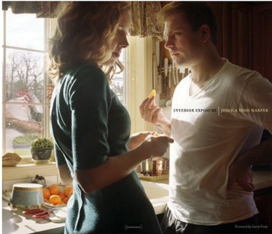
Interior exposure