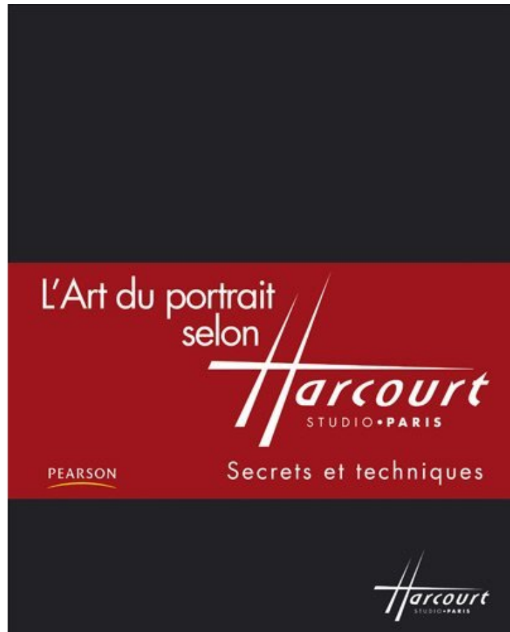
Coffret L'art du portrait selon Harcourt de Studio Harcourt