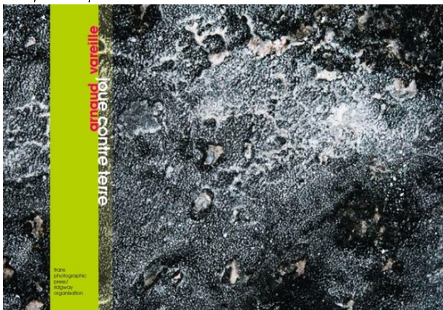
Joue contre terre d'Arnaud Vareille

Je prends des photographies de sols depuis plusieurs années. Ces images prises de ma hauteur, sans artifice, sont des portions des sols sur lesquels j'ai marché. Elles ont été faites sans que le besoin en ait été exprimé consciemment. Il s'agit plutôt d'une manie, d'un réflexe, qui s'est fait jour au fil des voyages. C'est en organisant mes archives que j'ai pris la mesure de la collection constituée. (...) La notion de partage et d'échange, tellement essentielle lorsqu'il s'agit de la terre, m'a inspiré le principe de collaboration que j'allais proposer aux différents auteurs : "Je vous offre une photographie de votre choix et un livre en échange d'un texte qui raconte ce que l'image choisie vous inspire ou représente pour vous."