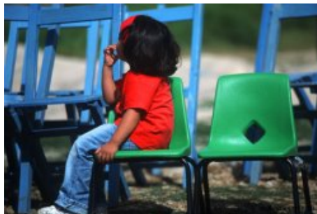
Maya Solidarité

En achetant cet ouvrage dont les droits sont intégralement reversés à Maya Solidarité, vous participerez vous aussi à la sauvegarde des derniers Mayas