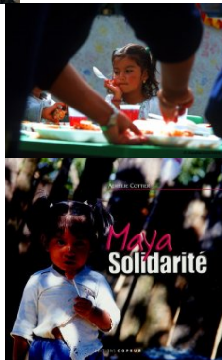
Maya Solidarité