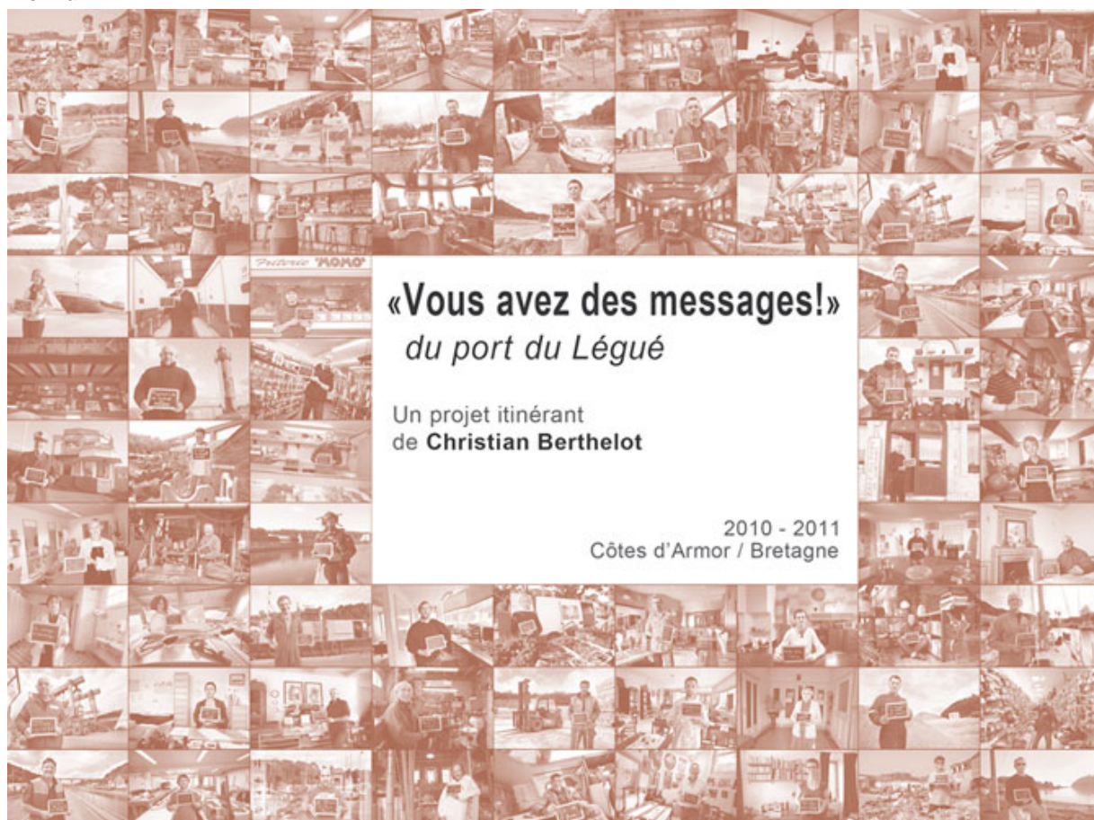
Vous avez des messages ! du port du Légué de Christian Berthelot