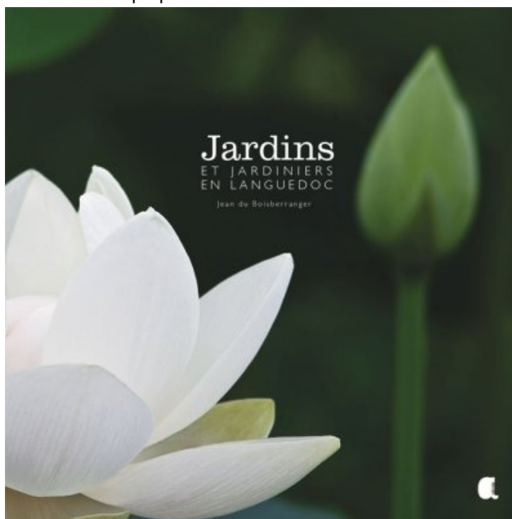
Jardins et jardiniers en Languedoc de Jean Du Boisberranger

Dans cet ouvrage, chaque jardinier raconte son oeuvre, révélée à son tour par les photographies exceptionnelles de Jean du Boisberranger. Chatoyantes ou secrètes, toujours dans la finesse des nuances, ces photographies saisissent au gré des saisons et des heures la beauté de ces jardins et restituent de manière éblouissante l'émotion qui se dégage de ces espaces en création perpétuelle.