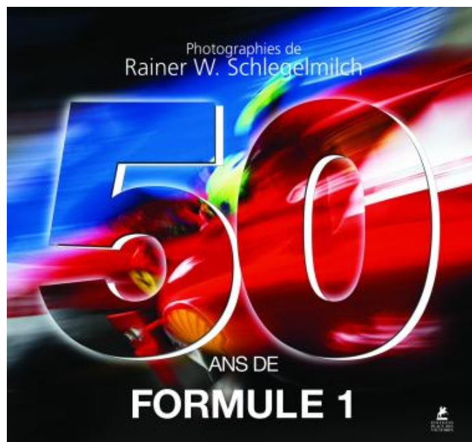
50 ans de formule 1 de Rainer W. Schlegelmilch

Cet ouvrage est illustré par plus de 1 300 clichés tirés des abondantes archives de Schlegelmilch, reconnu comme l'un des meilleurs photographes de F1 du monde. Il couvre tous les aspects de ce sport unique. Une documentation incontournable en images pour tous les passionnés de l'une des plus grandes aventures sportives - et humaines - de l'histoire. !