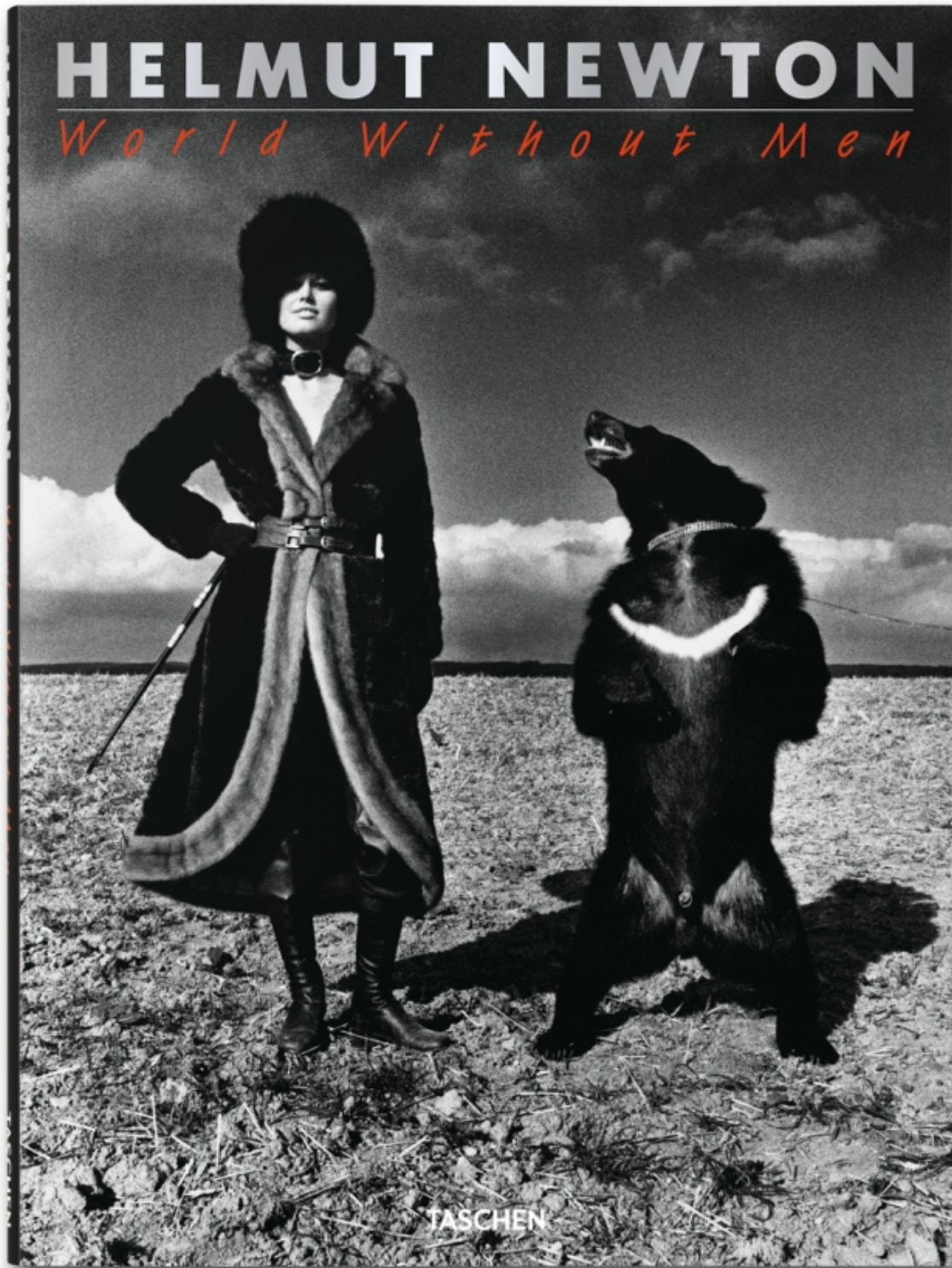
World Without Men de Helmut Newton