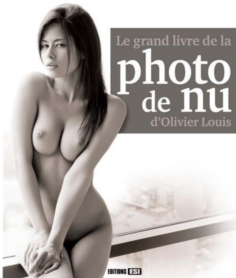
Le grand livre de la photo de nu d'Olivier Louis

Une série de photos étonnantes où lignes et ombres dessinent des images simples et sensuelles.