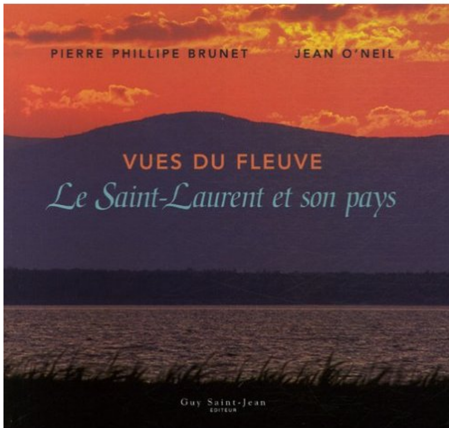
Vues du fleuve : Le Saint-Laurent et son pays de Pierre-Philippe Brunet, Jean O'Neil

De Vaudreuil-sur-le-Lac jusqu'à Gaspé en passant par Mingan, Kamouraska et Baie-Saint-Paul, l'histoire peut se raconter en images de saisons, de bateaux, de ponts, de quais, de rivages, de jardins, de maisons, de clochers et de ciels. C'est ce à quoi ce livre vous invite.