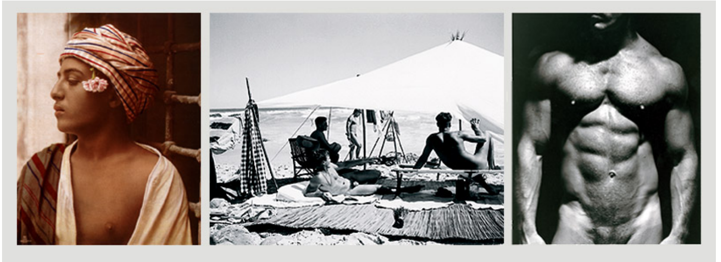
Hommes pour Hommes : Homoerotisme et homosexualit  masculine dans l'histoire de la photographie depuis 1840 de Pierre Borhan, Olivier Saillard