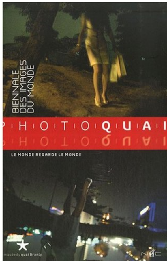
Photo Quai : Le monde regarde le monde, Biennale des images du monde de Stéphane Martin, Jean Loup Pivin

Un nouveau festival de l'image initié par le musée du quai Branly. Imaginée en alternance avec le Mois de la Photo à Paris, la première édition de Photoquai a lieu du 30 octobre au 25 novembre 2007, au musée, sur les quais de la Seine et dans une dizaine d'institutions partenaires de renom.