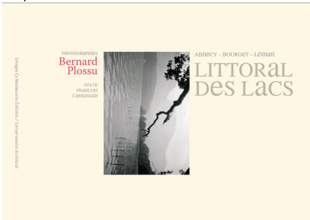
Littoral des lacs de Bernard Plossu

par Emmanuel Lopez Directeur du Conservatoire du littoral