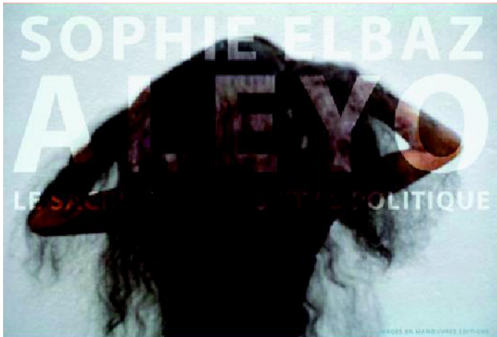
Aleyo : le Sacré, le Corps et le Politique de Sophie Elbaz