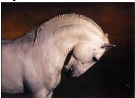
Chevaux Â© Yann Arthus-Bertrand

Devenu grand spécialiste de la photographie aérienne, il rencontre un succès planétaire grâce à La Terre vue du ciel, paru aux Editions de la Martinière en 1999. Dans le même temps, il continue à étudier la relation particulière entre l'homme et l'animal à travers des portraits. Auteur aux Editions du Chêne de plusieurs ouvrages : Tendres tueurs, Bestiaux, Les chiens, Les chats, il a publié de nombreux titres de la collection Vue du ciel, parmi lesquels Paris (version bilingue), Les côtes de Bretagne, La Loire, Les îles de France.